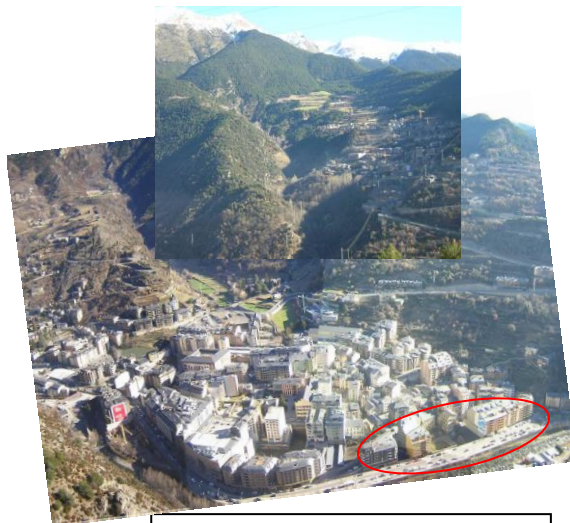
La Valireta, Sant Julià de Lòria